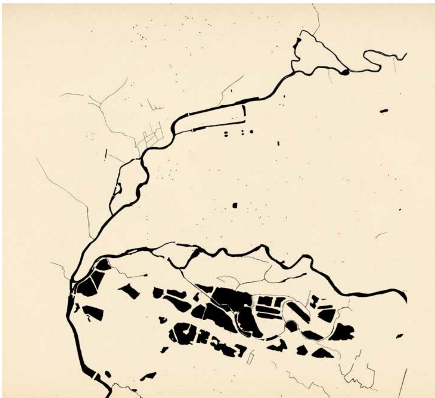
Cartographie du réseau hydrographique de Lunéville

J'explore les abords des rivières Vezouze et Meurthe à Lunéville et leurs connexions avec leur bassin-versant à travers la photographie argentique à la chambre, l'écriture et la cartographie. Je porte pour cela un regard nourri par les pensées de l'écologie, l'anthropologie et la géologie sur les industries et artisanats passés-présents, les activités de loisirs, les enjeux paysagers contemporains et les habitats humains et non-humains dans une approche documentaire poétique, sensible et variant les points de vues.