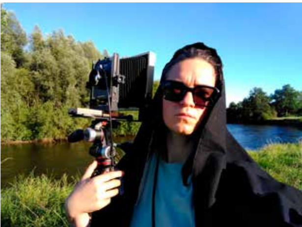
Mode veuve sicilienne activé

Après presque deux semaines d'arpentage, je suis enfin passée à la prise de vue à la chambre, mon amie antediluvienne. 4 châssis de plans-films : la possibilité de faire 8 images et c'est tout !